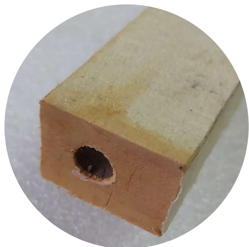
Cada bloque sirve como nido para una abeja o avispa solitaria

Si bien la conocida abeja de la miel vive en colonias, la mayoría de las especies de abejas y avispas son solitarias . Algunas nidifican bajo tierra, pero otras construyen sus nidos en huecos existentes o los generan ellas mismas como las abejas carpinteras.