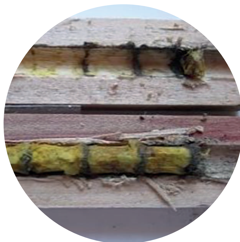
Nido de abeja construido dentro del bloque de madera