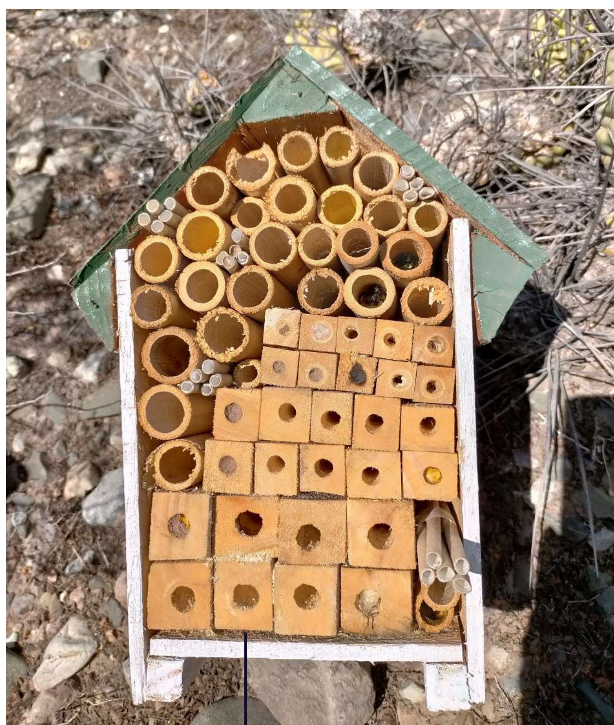
Hotel para abejas

Están contruidos por materiales orgánicos (madera y caña principalmente) y presentan cavidades de distinto diámetro, las cuales serán aprovechadas por estos animales.