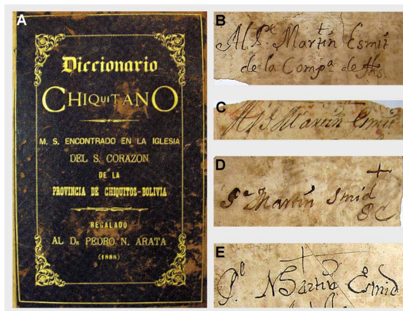
Fig. 1. A, Vocabulario Chiquitano-Español, Biblioteca Arata, MS. Inv. 13.581. Tapa de la reencuadernación en cuero, ca. 1888. B-E, Vocabulario de la lengua chiquita parte 1ª Español-Chiquito , Biblioteca Arata, MS. Inv. 13.580. Detalles de cinco fragmentos de cartas que formaban parte del cartón de la encuadernación original del MS; en todos ellos aparece Martín Schmid como destinatario de cartas redactadas por manos diferentes.

'...Estos fragmentos de cartas han servido para formar el cartón con el que estaba encuadernado este tomo del Diccionario Chiquitano, comprado al Padre De Pedri –de los Misioneros franciscanos del Chaco- por 200$. 1904 [firmado] P.N. Arata...'