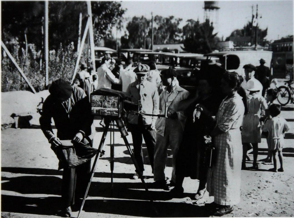
Fotógrafo ambulante en el Balneario Municipal, Buenos Aires. Equipo de fotógrafos de Caras y Caretas, febrero de 1938. AGN